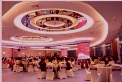
寄语金龙商学院：微笑、善良、孝顺、事业心——你们永远是学校亮丽的风景线

吃和玩是未来人类生活的方向，但不是简单的吃好，需要有主题、有意义、有价值。未来，希望同学们可以开发食品，开发意义，人类的幸福生活需要你们食品专业的学生来倡导和开发创造。